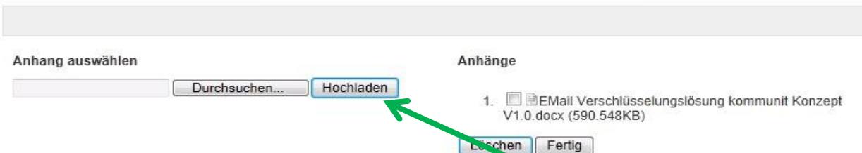
Bild: Anhänge in Antwort anfügen

Nachdem der Anhang über „Durchsuchen“ ausgewählt wurde, unbedingt den Button „Hochladen“ anwählen . Erst wenn auf der rechten Seite unter Anhänge das Dokument auftaucht, wird es in Ihrer Antwort mit gesendet.